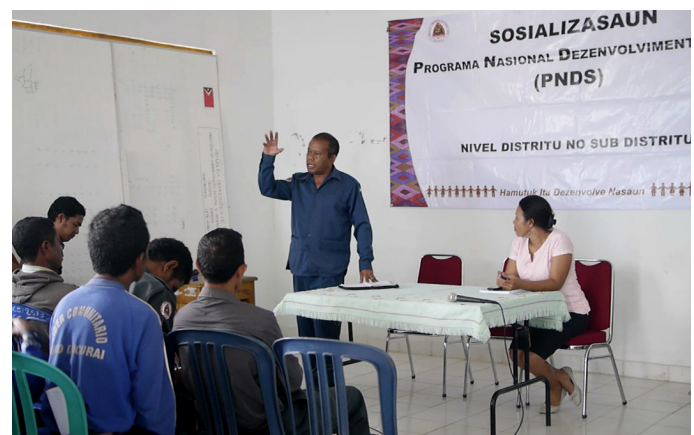
Socializasaun iha Letefoho, Ermera