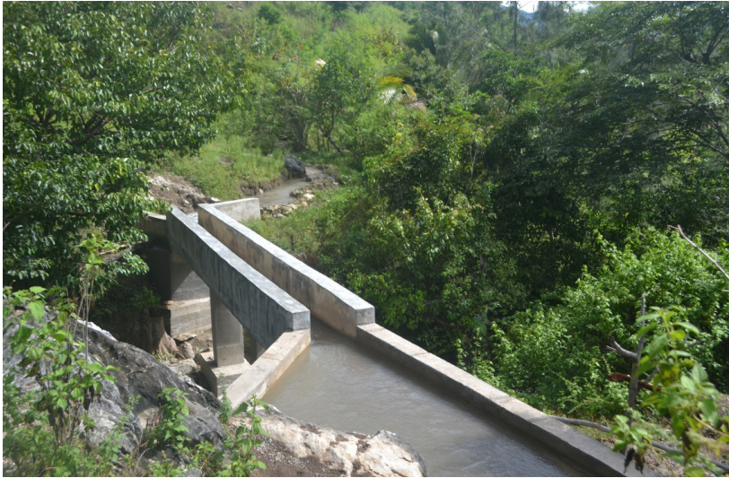
Ponte Irigasaun iha Suku Tiarlelo, Postu Administrativo Atsabe, Munisipiu Ermera